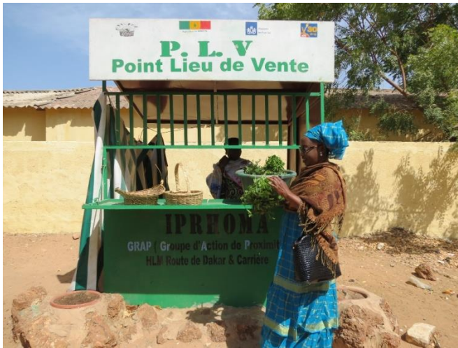
Point de vente de légumes biologiques à Thiès