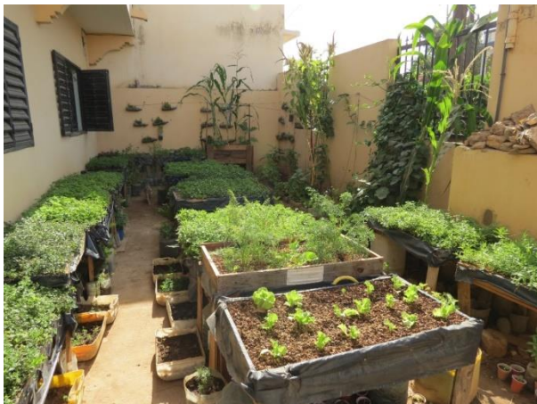
Jardin urbain du CEEDD