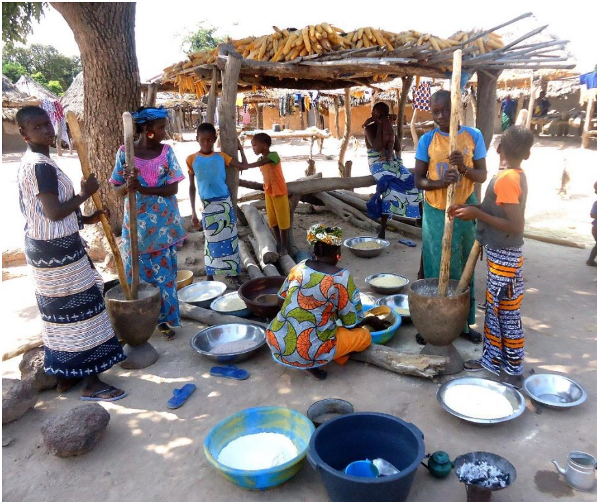
Rencontre de bénéficiaires du projet