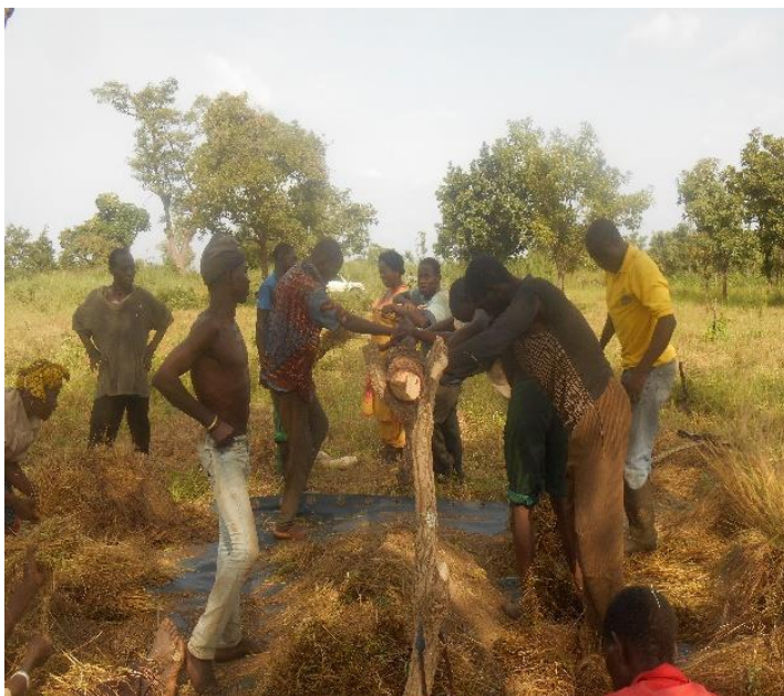
Fouillage de fonio