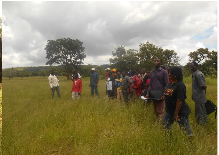
Visite et formation paysan à paysan