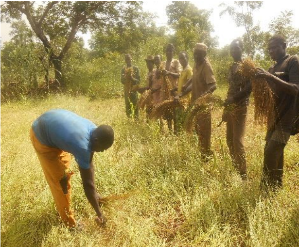
Récolte de fonio