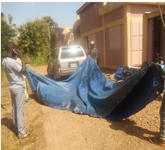
Distribution de bâches à Boukombé