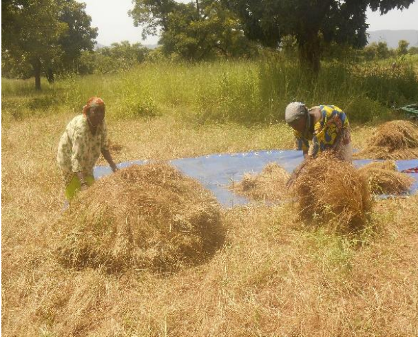
Récolte de fonio