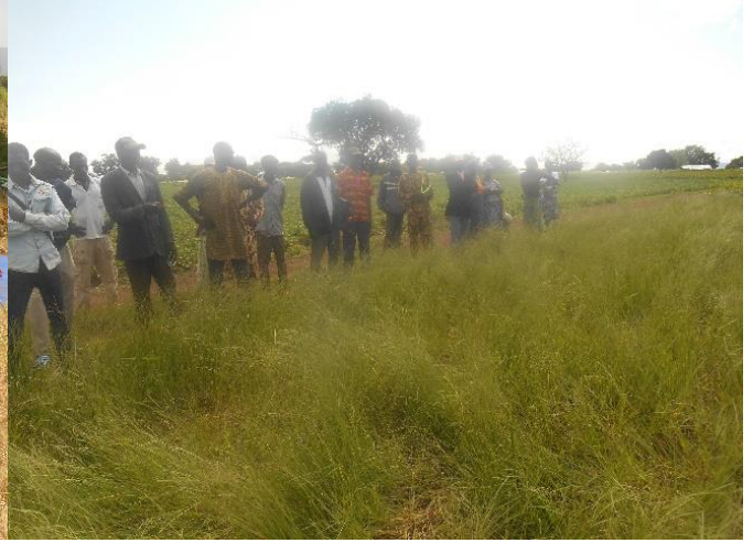
Visite et formation paysan à paysan