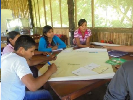
École agro-écologique familiale, Palos Blancos (ici, groupe de jeunes)