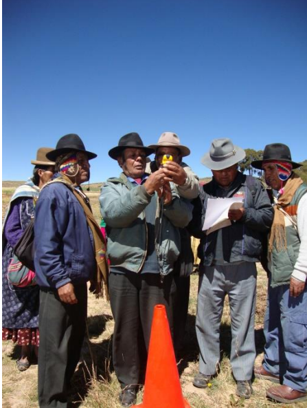
Élaboration de cartes pour l'aménagement du territoire, province d'Ingavi.