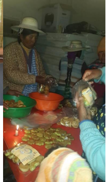
Entreprenariat par un groupe de femmes de Salinas de Garci Mendoza (élaboration de biscuits de quinoa).